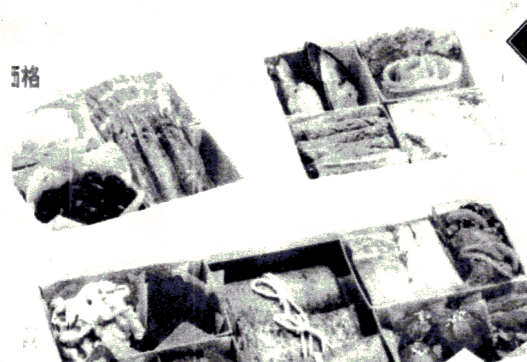
招福祝膳(和洋中3箱重) 15750円(税抜、送料込み)