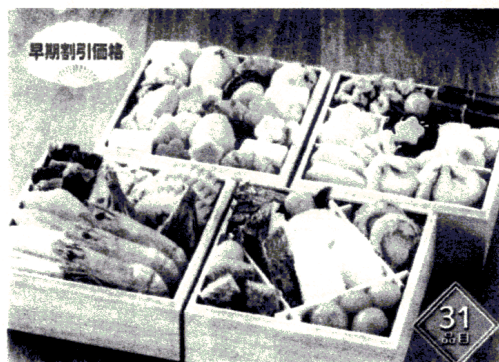
おせちの定番 京風おせち4段重 17203円(税抜、送料込み)