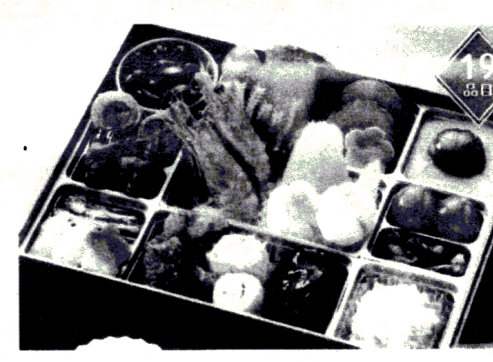
小人数でも! 盛り込みおせち1段重 10570円(税抜、送料込み)