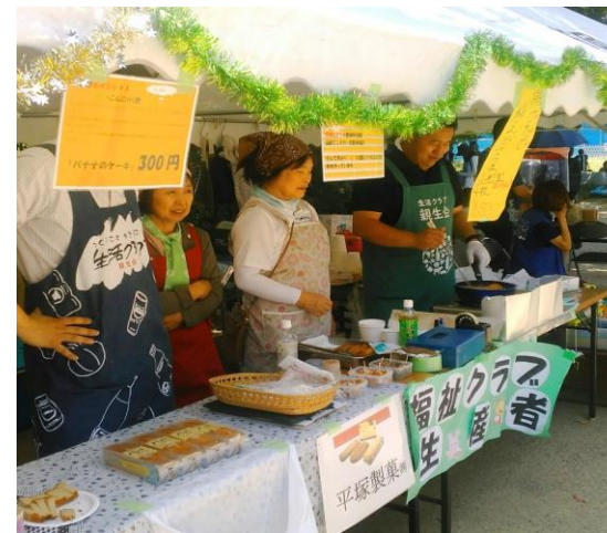
生産者コーナー(さつま揚げ、ビール)