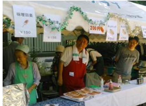
ホットドッグ、味噌田楽コーナー