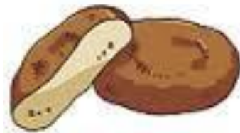
さつまあげ(桜エビ入り)